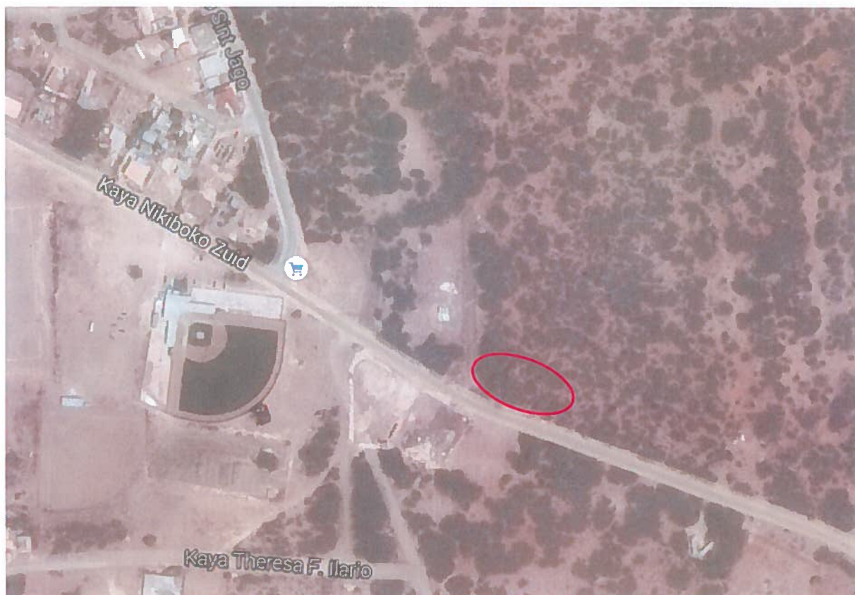
1. Ligging van het plangebied

Dit uitwerkingsplan wordt opgesteld om medewerking te kunnen verlenen aan het verzoek van de Chinese Association om een clubhuis te kunnen bouwen voor de Chinese gemeenschap op Bonaire. Met het uitwerkingsplan wordt uitvoering gegeven aan de in het Ruimtelijk Ontwikkelingsplan Bonaire opgenomen uitwerkingsplicht op perceel 4-G-3465.