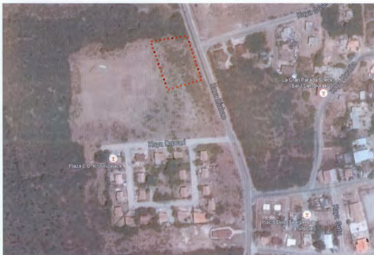
Figuur 1: plangebied

Dit uitwerkingsplan is opgesteld om medewerking te kunnen verlenen aan een initiatief ten behoeve van de bouw van een kantoorpand en aan de Kaminda Djabou. Middels dit uitwerkingsplan wordt uitvoering gegeven aan de in het Ruimtelijk Ontwikkelingsplan Bonaire opgenomen uitwerkingsplicht om de ten westen van de Kaminda Djabou gelegen bestemming 'Gemengd - Uit te werken 1' uit te werken.