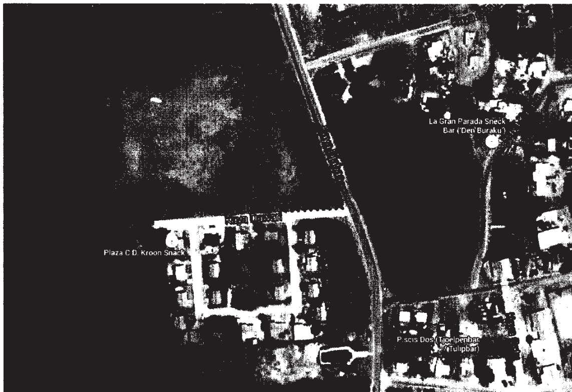
Figuur 1: plangebied uitwerkingsplan Kaminda Djabou

Aanleiding om dit te doen, is de voorgenomen uitgifte in erfpacht van een perceel ten westen van de Kaminda Djabou. Om de bouwvergunningen ten behoeve van het initiatief te kunnen verlenen, moet er een door het Bestuurscollege vastgesteld en in werking getreden uitwerkingsplan zijn.