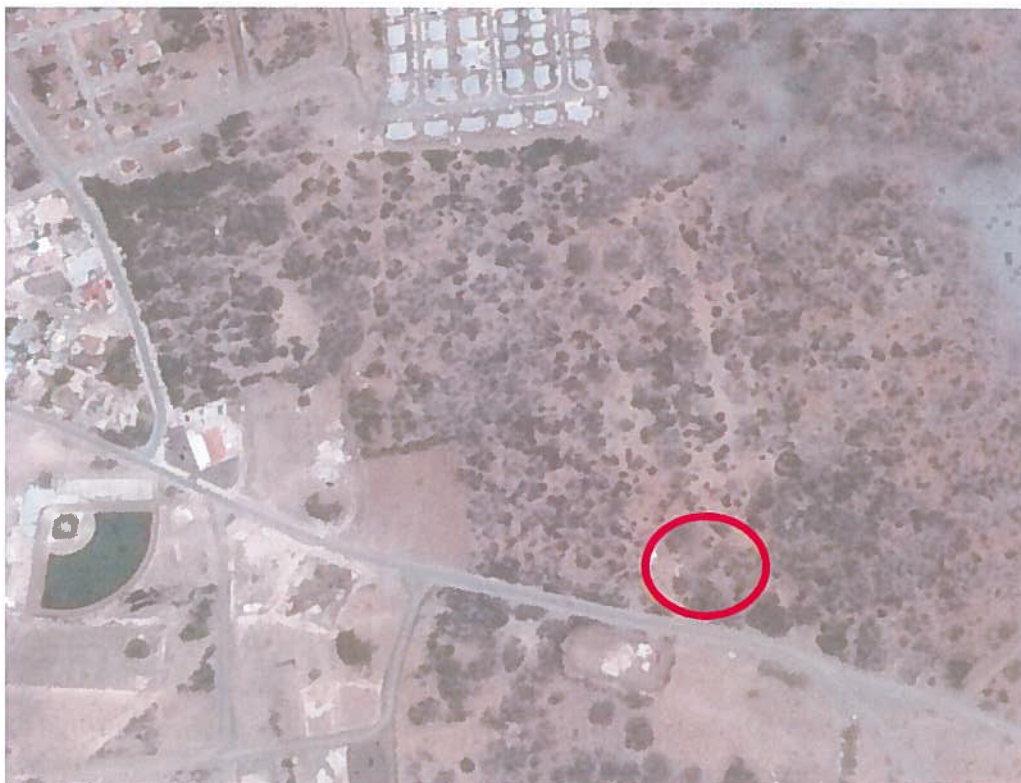
1. Ligging van het plangebied

Dit uitwerkingsplan wordt opgesteld om medewerking te kunnen verlenen aan het bij het bestuurscollege ingediende plan van Flamingo Adventure Golf BV voor het bouwen van een woonhuis en het aanleggen van een minigolfbaan. De basis tot het maken van een uitwerkingsplan voor initiatieven als het onderhavige is opgenomen in het Ruimtelijk Ontwikkelingsplan Bonaire.