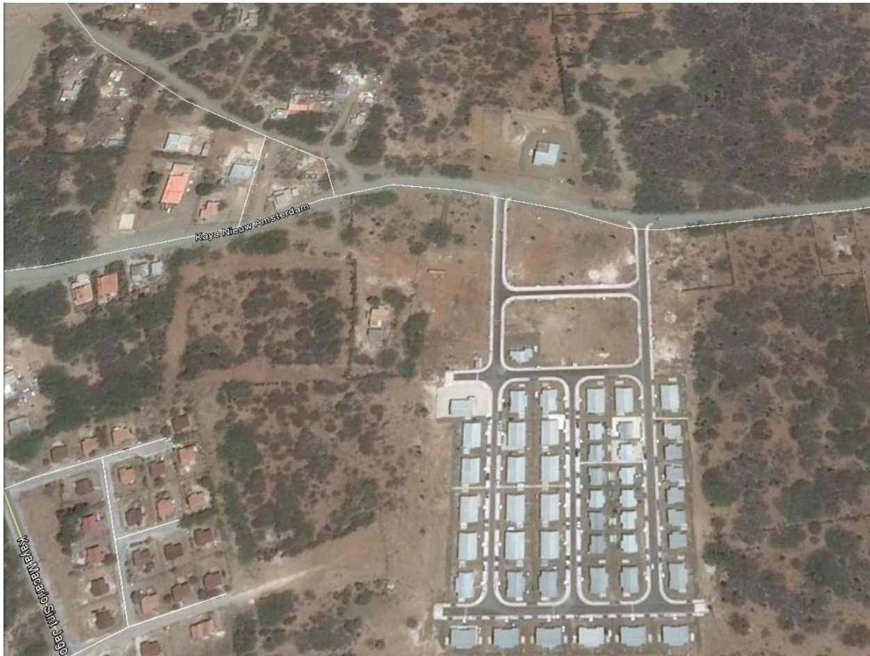
1. Ligging van het plangebied

De basis tot het maken van een uitwerkingsplan voor initiatieven als het onderhavige is opgenomen in het Ruimtelijk Ontwikkelingsplan Bonaire.