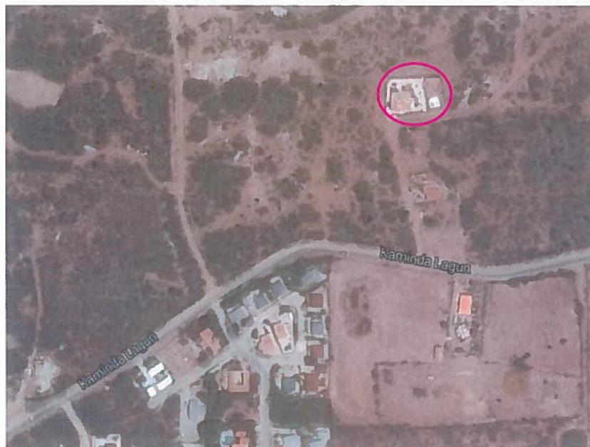
1. Ligging van het plangebied

Dit uitwerkingsplan wordt opgesteld om medewerking te kunnen verlenen aan het ingediende bouwplan van de heer Strootman. De verplichting tot het maken van een uitwerkingsplan voor initiatieven als het onderhavige is opgenomen in het Ruimtelijk Ontwikkelingsplan Bonaire.