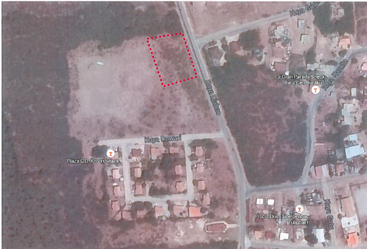
Figuur 1: plangebied

Dit uitwerkingsplan is opgesteld om medewerking te kunnen verlenen aan een initiatief ten behoeve van de bouw van een kantoorpand en aan de Kaminda Djabou. Middels dit uitwerkingsplan wordt uitvoering gegeven aan de in het Ruimtelijk Ontwikkelingsplan Bonaire opgenomen uitwerkingsplicht om de ten westen van de Kaminda Djabou gelegen bestemming 'Gemengd - Uit te werken 1' uit te werken.